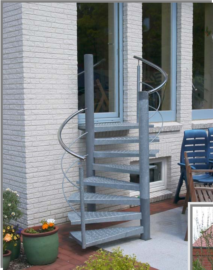
Objekt (020204): Treppe Spindel und Kragarme feuerverzinkt, mit Stufen in Lochblechrosten, „S“ Form, Geländer in Stahl, feuerverzinkt, Handlauf Edelstahl, gebürstet.