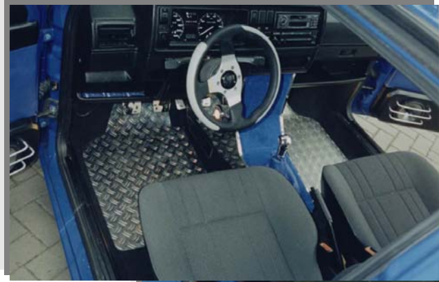
Objekt (010303): VW Golf, diverse Teile in poliertem Edelstahl mit Samtbezug und Halogenlampen, Aluminium-Quintettblech-Matten.